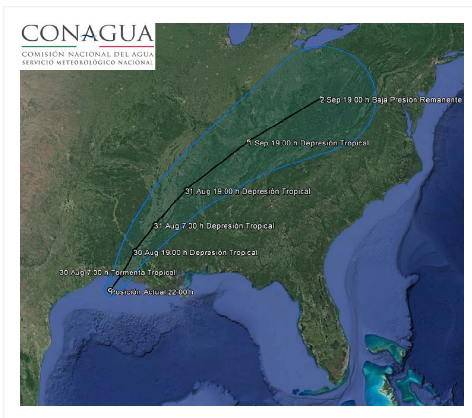
Trayectoria pronóstico de la Tormenta Tropical "Harvey"